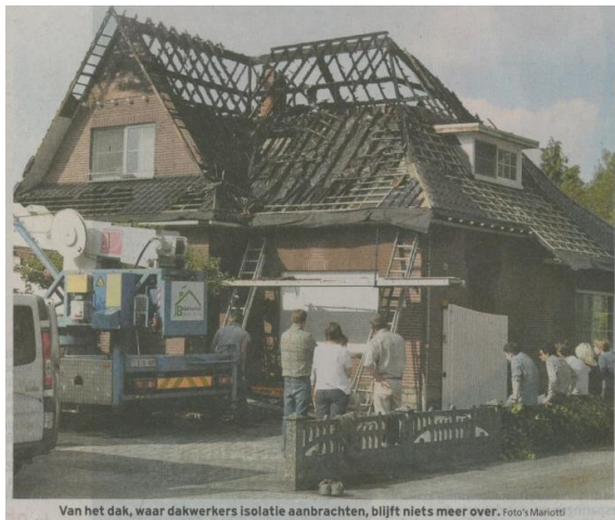
Van het dak, waar dakwerkers isolatie aanbrachten, blijft niets meer over.