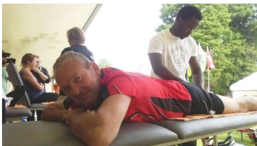
Geschreven door Wellens Steven maandag, 02 september 2013

Al dat gezoef leverde helaas niet veel op, want we haalden 18u niet. Meer zelfs, wij waren de allerlaatsten van alle deelnemers (hou het stil) ... Maar wij hebben ons zeker en vast het best geamuseerd. Volgend jaar keren we terug voor een nog sterkere prestatie!